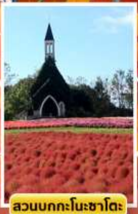
สวนบกกะโนะซาโงง่า