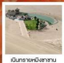
เขื่อนทรายหมิงซาซาน