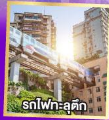
รถไฟฟ้า-สุตึก

เที่ยวเต็มอิ่ม..ไม่ลงร้านช้อปปิ้ง นั่งรถไฟความเร็วสูง 2 เที่ยว ไม่มีออฟชั่นเพิ่ม