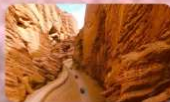
แกรนด์แคนยอนอาวูซือ