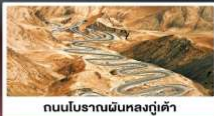
ถนนโบราณผืนหลงกู่เต้า