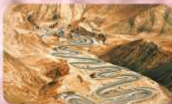
ถนนโบราณผืนหลงกู่ต้า