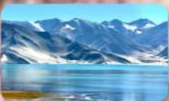
ทะเลสาบไป่ซาหู