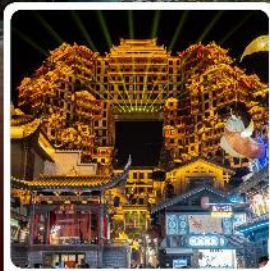
ตึกมหัศจรรย์ 72