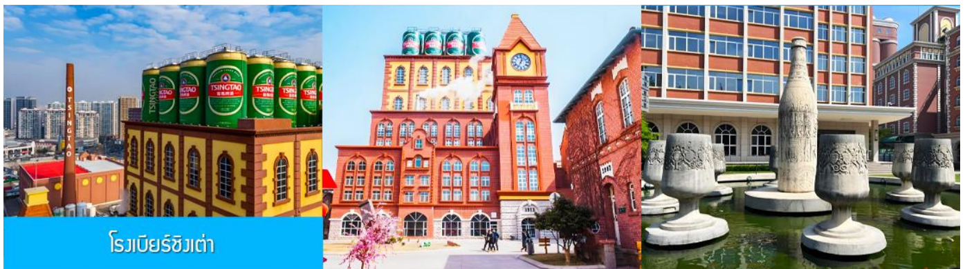
โรงเบียร์ชิงเต่า

จากนั้นนำท่านเที่ยวชม โรงเบียร์ชิงเต่า 青岛啤酒博物馆 พิพิธภัณฑ์เบียร์ที่ขึ้นชื่อของเมืองชิงเต่า ซึ่งเป็นเบียร์ยี่ห้อแรกที่ผลิตขึ้นในประเทศจีน ชมเบียร์ คอลเลกชันที่มียี่ห้อหลากหลายที่สุดของโลก และชมการจัดแสดงภาพและวิทัศน์เกี่ยวกับวิวัฒนาการของเบียร์ ขั้นตอนการผลิตและอื่น ๆ ที่เกี่ยวข้อง พร้อมชิมเบียร์ชิงเต่า ซึ่งเป็นเบียร์ที่ขายดีที่สุดยี่ห้อหนึ่งของจีน.. (ชิมเบียร์ชิงเต่าท่านละ 1 แก้ว รับกลับอีก 1 ขวดเล็ก ตอนเดินออก)