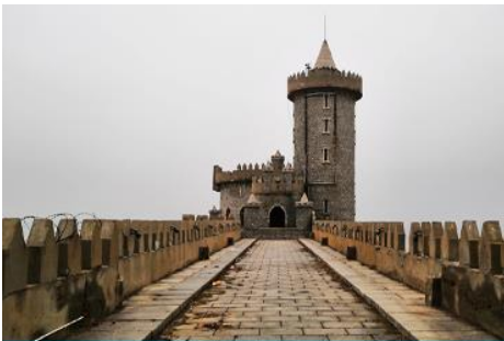
คาเฟ่อีสดง