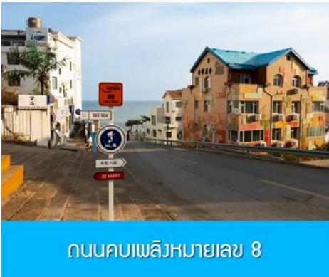
ถนนคอบเพลิงหมายเลข 8

นำท่านจิบไวน์ในปราสาทสไตล์ยุโรป หลีกหนีความวุ่นวายและก้าวเข้าสู่ดินแดนที่ราวกับหลุดมาจากเทพนิยายยุโรป ณ ไร่ไวน์ ชาโตว์ ณ คฤหาสน์ งามอยู่ ปราสาทไวน์อันโอ่อ่าที่ตั้งตระหง่านกลางไร่องุ่นสุดลูกหูลูกตาในเมืองเยียนไถ มณฑลซานตง ที่นี่คือการบรรจบกันอย่างลงตัวของมรดกการผลิตไวน์กว่าร้อยปีของจีนและความเชี่ยวชาญจากฝรั่งเศส ทำให้เกิดเป็นแหล่งท่องเที่ยวที่ไม่เพียงสวยงามน่าถ่ายรูป แต่ยังเป็นสวรรค์ของคนรักไวน์ นำท่านเดินชมสถาปัตยกรรมคลาสสิก เยี่ยมชมห้องเก็บไวน์ใต้ดินอันลึกลับ และปิดท้ายด้วยการชิมไวน์รสเลิศที่ผลิตจากองุ่นในไร่แห่งนี้ เสริมแต่งประสบการณ์ที่จะทำให้การเดินทางของคุณพิเศษยิ่งขึ้น ปิดท้ายประสบการณ์อันสุดแสนคลาสสิกนี้... ด้วยการ ลิ้มรสไวน์แดง (ท่านละ 1 แก้ว) ที่มีชื่อเสียงของที่นี่, จากนั้น นำท่านเดินทางสู่ เมืองเวย์ไห้ 威海 ตั้งอยู่ปลายสุดของคาบสมุทรซานตง ซึ่งเป็นเมืองท่าสำคัญที่มีชายฝั่งทะเลสวยงามสะอาด อากาศเย็นสบายในฤดูร้อนและมีหิมะตกหนักในฤดูหนาว ได้รับอิทธิพลวัฒนธรรมเกาหลีได้เนื่องจากที่ตั้งใกล้ที่สุด จุดเด่นคือเกาะหลิวกง เมืองหัวเซี่ยเฉิง และบรรยากาศเมืองท่าที่พักผ่อนสบาย นำท่านเก็บบรรยากาศกับ กรอบรูปวิวทะเล อีกหนึ่งไฮไลท์สุดฮิตที่มาเวย์ไห้ ต้องถ่ายรูปกับจุดนี้