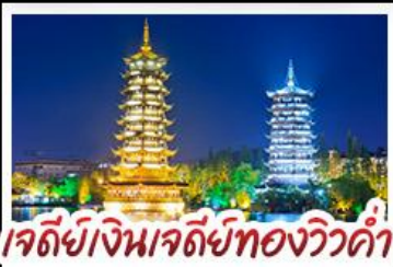
เจดีย์เงินเจดีย์ทองวิวคำ

เมนูพิเศษ บุฟเฟ่ต์ชาบูซีฟู้ด ปลาอบเบียร์ ฝ่อกคริสตัล สุกี้หัด