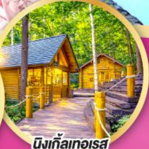
มิงกัลเกอรา