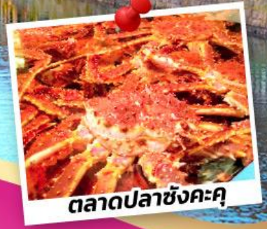
ตลาดปลาซังคะคุ

พักโฮตารุ 1 คืน สัมผัสน้ำพุร้อนโรแมนติก พักชิปปังโจ 2 คืน ซ้อปปังโจ