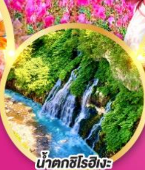
น้ำตกชิโรอิเงะ