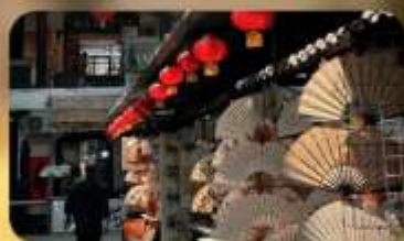
ถนนโบราณซูเยี่ยนเหมิน