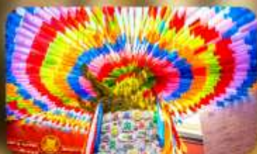
วัดลามะกว้างเหริน