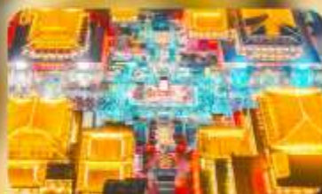
ถนนวัฒนธรรมต้าถิง