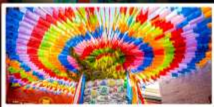
วัดลามะกว้างเหริน