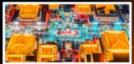
ถนนวัฒนธรรมต้าถิง