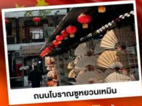
ถนนโบราณซูหยวนเหมิน