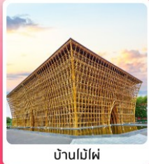
บ้านไม้ไผ่

ไอโอล์ เที่ยวครบ สวนน้ำ Aquatopia & สวนสนุก Vin Wonder เวนิสแห่งเวียดนาม Grand World Phu Quoc แลนด์มาร์คสุดโรแมนติก