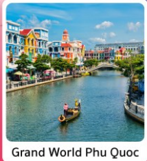
Grand World Phu Quoc