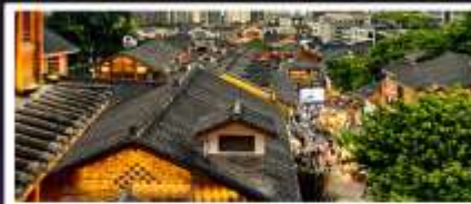
เมืองโบราณสี่ปาตี