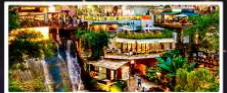
ถนนโบราณหลงเหมินฮ่าว