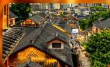
เมืองโบราณสี่ปาที้