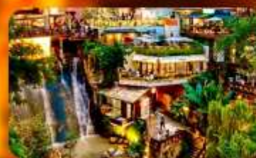
ถนนโบราณหลงเหมินฮ่าว