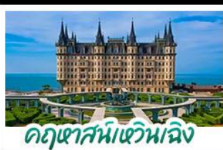
ฤดูหาสมบัติหิวถึง

เมืองท่าชิงเต่า - ฤดูหาสมบัติหิวถึง เบียร์ชิงเต่า + อาหารทะเล สตรีทอาร์ต สตูดิโอจิบลิ