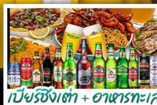
เบียร์ชิงเต่า + อาหารทะเล