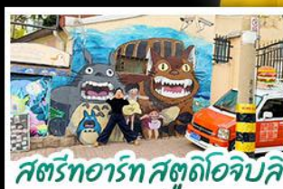
สตรีทอาร์ต สตูดิโอจิบลิ