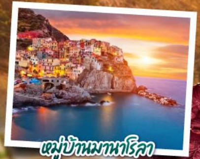
หมู่บ้านมานาโรลา