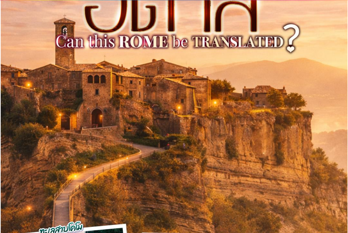
ทะเลสาบคิมิ