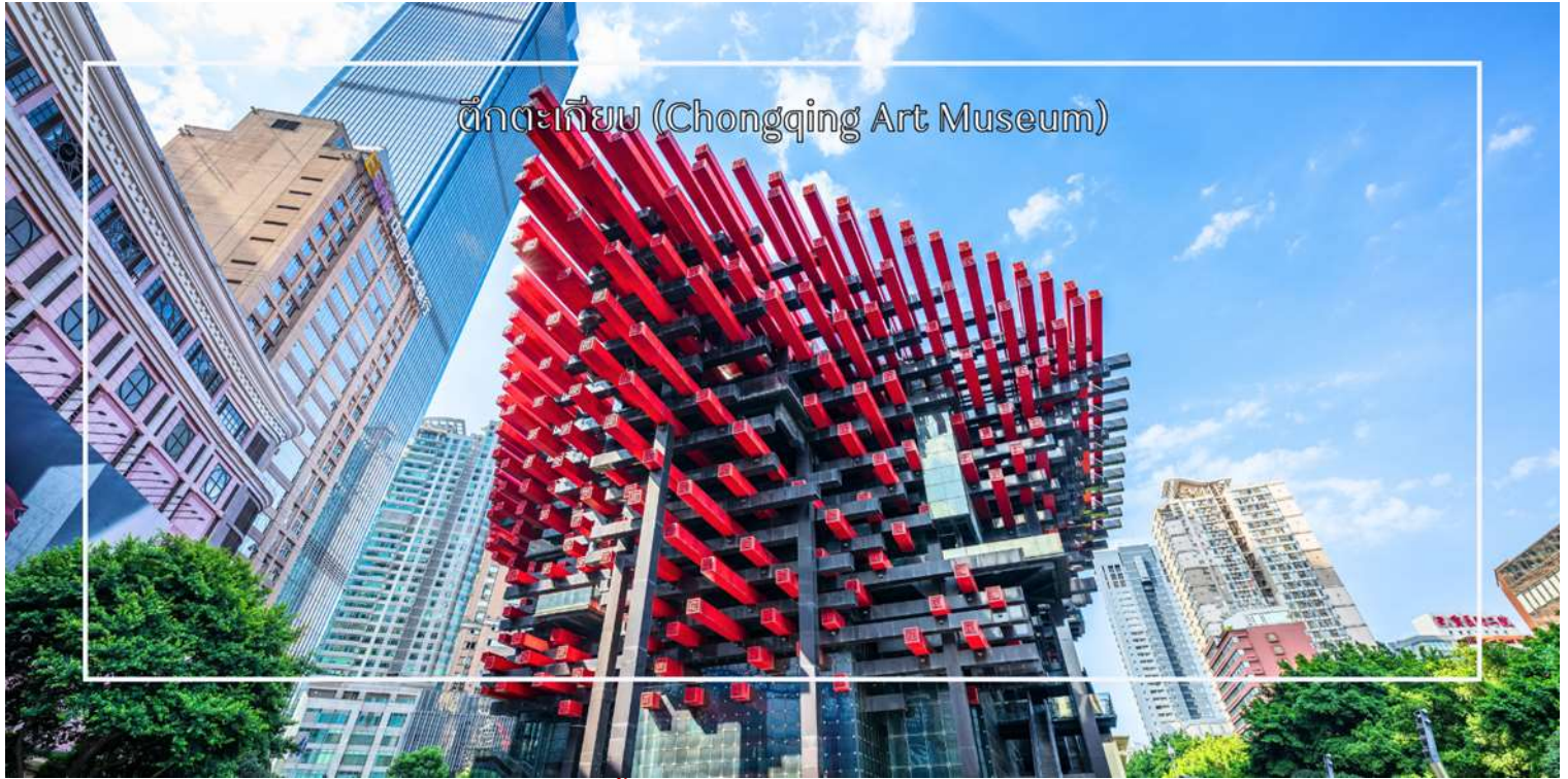
ตึกตะเกียบ (Chongqing Art Museum)

จากนั้นนำท่านชม ตึกไควชิงโหล (Kuaiqinglou) 22 ชั้น ตึกสุดแปลกเดินจากชั้น 1 กลายเป็นชั้นที่ 22 แลนด์มาร์กสำคัญที่ตั้งตระหง่านอยู่ใจกลางเมืองฉงชิ่ง โดดเด่นด้วยสถาปัตยกรรมสูงส่งที่ผสมผสานความทันสมัยเข้ากับเสน่ห์ของวัฒนธรรมท้องถิ่นอย่างลงตัว จากชั้นบนสุดของตึกสูง 22 ชั้นแห่งนี้ ท่านจะได้ชมทัศนียภาพแบบพาโนรามา 360 องศา ทั้งแม่น้ำแยงซีที่ทอดยาวคดโค้งและภาพเมืองฉงชิ่ง จากนั้นแวะถ่ายรูปและสัมผัสความสวยงามของ ตึกตะเกียบ (Chongqing Art Museum) แลนด์มาร์กสุดแปลกตาใจกลางเมือง ที่ออกแบบอาคารให้มีลักษณะคล้ายตะเกียบ ยักษ์สีแดง-ดำซ้อนกันอย่างโดดเด่น อาคารแห่งนี้เป็นที่ศูนย์จัดแสดงศิลปะร่วมสมัยและจุดถ่ายภาพยอดนิยมของนักท่องเที่ยว ด้วยดีไซน์ทันสมัยและเอกลักษณ์เฉพาะตัว ทำให้ที่นี่กลายเป็นหนึ่งในสถานที่ที่ต้องมาเยือน