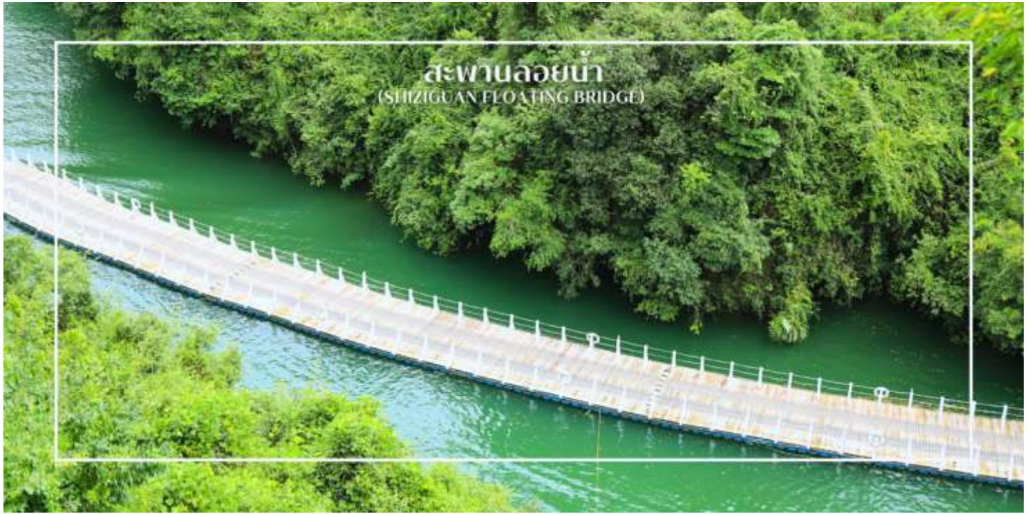
สะพานลอยน้ำ (SHIZIGUAN FLOATING BRIDGE)

สมควรแก่เวลานำท่านสู่ ถนนคนเดินเินซือ (Enshi Daughter City Pedestrian Street) หรือเรียกอีกชื่อ ถนนคนเดินเมืองลูกสาวเินซือ เป็นศูนย์กลางกิจกรรมท้องถิ่นที่เต็มไปด้วยสีสันและวัฒนธรรมของเินซือ ถนนเส้นนี้เต็มไปด้วยร้านค้า ร้านอาหาร และแผงขายสินค้าพื้นเมือง ทั้งของฝาก งานหัตถกรรม และอาหารท้องถิ่น ทำให้นักท่องเที่ยวได้สัมผัสวิถีชีวิตของคนท้องถิ่นอย่างใกล้ชิด บรรยากาศในยามค่ำคืนมีชีวิตชีวา แสงไฟประดับถนนสวยงามตัดกับภูมิทัศน์เมืองเก่า และมีมุมถ่ายภาพสวยๆ ให้ผู้มาเยือนได้เก็บความประทับใจ