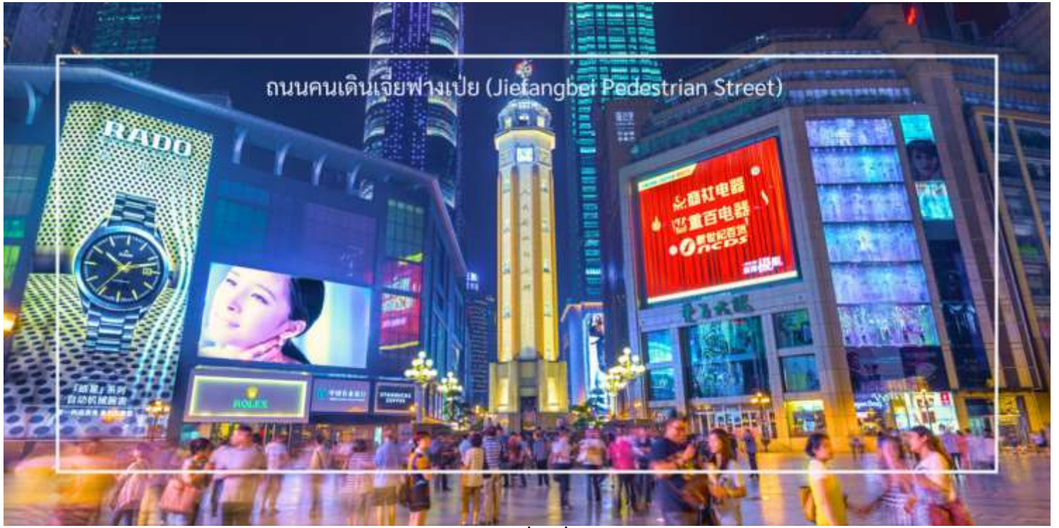
ถนนคนเดินเจียงฟางเป่ย์ (Jiefangbei Pedestrian Street)

ได้เวลาอันสมควร นำท่านเดินทางสู่สนามบินฉงชิ่ง เพื่อเดินทางกลับ