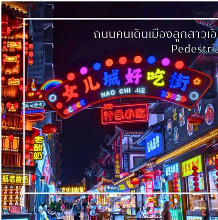
ถนนคนเดินเมืองลูกสาวเินซือ (Enshi Daughter City Pedestrian Street)

สมควรแก่เวลานำท่านสู่ ถนนคนเดินเินซือ (Enshi Daughter City Pedestrian Street) หรือเรียกอีกชื่อ ถนนคนเดินเมืองลูกสาวเินซือ เป็นศูนย์กลางกิจกรรมท้องถิ่นที่เต็มไปด้วยสีสันและวัฒนธรรมของเินซือ ถนนเส้นนี้เต็มไปด้วยร้านค้า ร้านอาหาร และแผงขายสินค้าพื้นเมือง ทั้งของฝาก งานหัตถกรรม และอาหารท้องถิ่น ทำให้นักท่องเที่ยวได้สัมผัสวิถีชีวิตของคนท้องถิ่นอย่างใกล้ชิด บรรยากาศในยามค่ำคืนมีชีวิตชีวา แสงไฟประดับถนนสวยงามตัดกับภูมิทัศน์เมืองเก่า และมีมุมถ่ายภาพสวยๆ ให้ผู้มาเยือนได้เก็บความประทับใจ