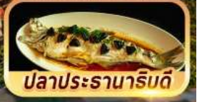
ปลาประจักษ์