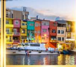
ท่าเรือประมงเจิ้งปิง