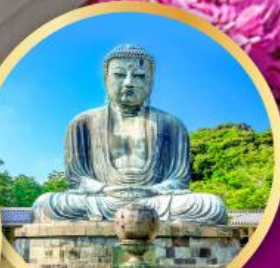
วัดโคโตคุอิน