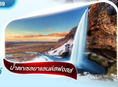
น้ำตกเซลยาแลนด์สฟอสส์