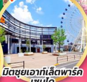
มิตซูเอากะเลียตพาร์ค เซนได