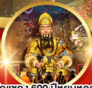
วัดแซก 600ปีหยุดหลง