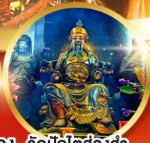
วัดปักไต้ฮ้องอำ