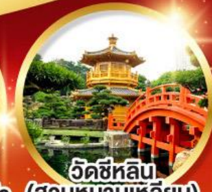
วัดซีหลิน (สวนหนานเท่หลิน)