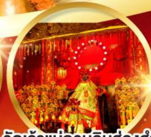
วัดเจ้าแม่กวนอิมฮ้องอำ