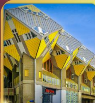
บ้านลูกเต่าโคกคูบัส

“ล่องเรือหลังคากระจก” ชมกรุงอัมสเตอร์ดัม