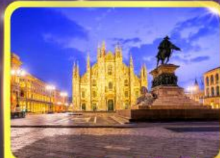
มหาวิหารคูโอโม