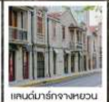
แลนด์มาร์กจางหยวน

เซี่ยงไฮ้ คคลาสสิก ไนท์ / 3 ดึกใหญ่แห่งเซี่ยงไฮ้ คองเรือหมู่บ้านโบราณจูเจียเจียว / EKA Tianwu / วัดหลงหัว แลนด์มาร์ก จางหยวน / ถนนหวยไห่ / ชมโชว์ ERA ที่โรงละครโด่งดังระดับโลก / ซินเทียนตี้