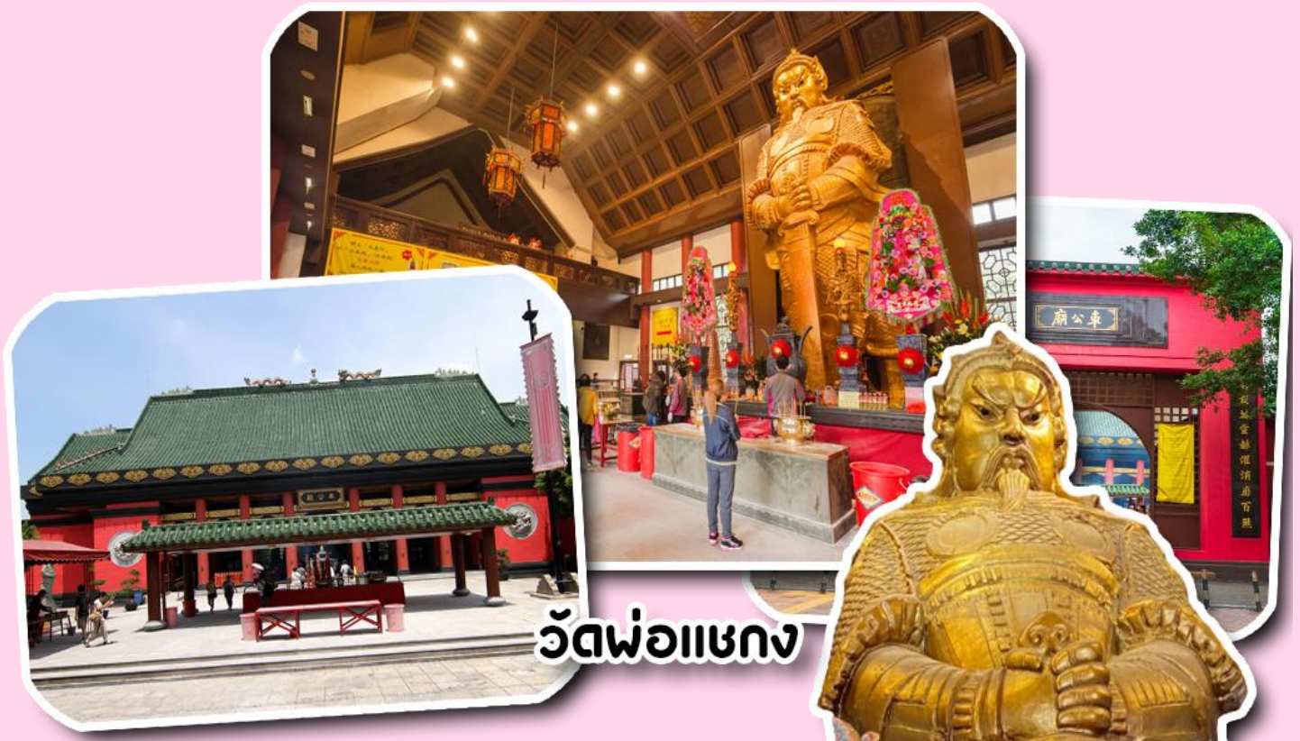
วัดพ่อແຂງ

หลังจากนั้น พาท่านช้อปปิ้งอิสระ ย่านจิมซาจ๋วย (tsim sha tsui) เป็นย่านช้อปปิ้งชื่อดังของเกาะฮ่องกง ที่คนไทยทั่ว ๆ ไปก็ต้องรู้จัก และพูดกันหนาหูติดปากมานาน ตั้งอยู่บริเวณริมอ่าววิคทอเรีย ของฝั่งเกาลูน ฮ่องกง เมื่อพูดถึงจิมซาจ๋วย ทุกคนก็ต้องนึกถึง ถนนนาธาน ซึ่งทอดยาวตั้งแต่จิมซาจ๋วยไปจนถึงย่านปรีนซ์ เอ็ดเวิร์ด นับเป็นถนนสายช้อปปิ้งอย่างแท้จริง และเป็นเสน่ห์อย่างหนึ่งของฮ่องกง ที่ทั้งสองฟากฝั่งของถนน จะเต็มไปด้วยร้านค้าต่างๆ มากมาย ทั้งเสื้อผ้าแบรนด์เนมชื่อดังทั่วโลก เครื่องหนังชั้นดี ห้างสรรพสินค้าทันสมัย ร้านอาหารและภัตตาคารสุดหรู โรงแรมตั้งแต่ระดับเกสต์เฮ้าส์ไปจนถึงระดับ 5 ดาว