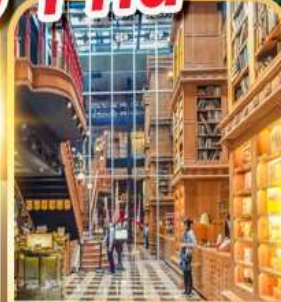
ร้านไอศกรีมมियाฮาร่า