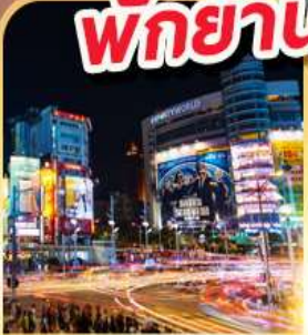
ย่านซีเหมินติง