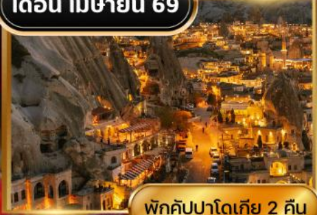
พักคัปปาโดเกีย 2 คืน