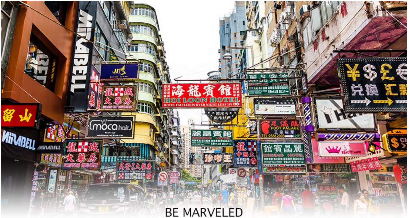
BE MARVELED MONGKOK

เครื่องประดับมากมาย อีกทั้งยังมีร้านอาหารและเครื่องคั้ม ที่ขึ้นชื่อหลากหลายชนิด ให้ทุกท่านได้ลองลิ้มรสอีก มากมาย