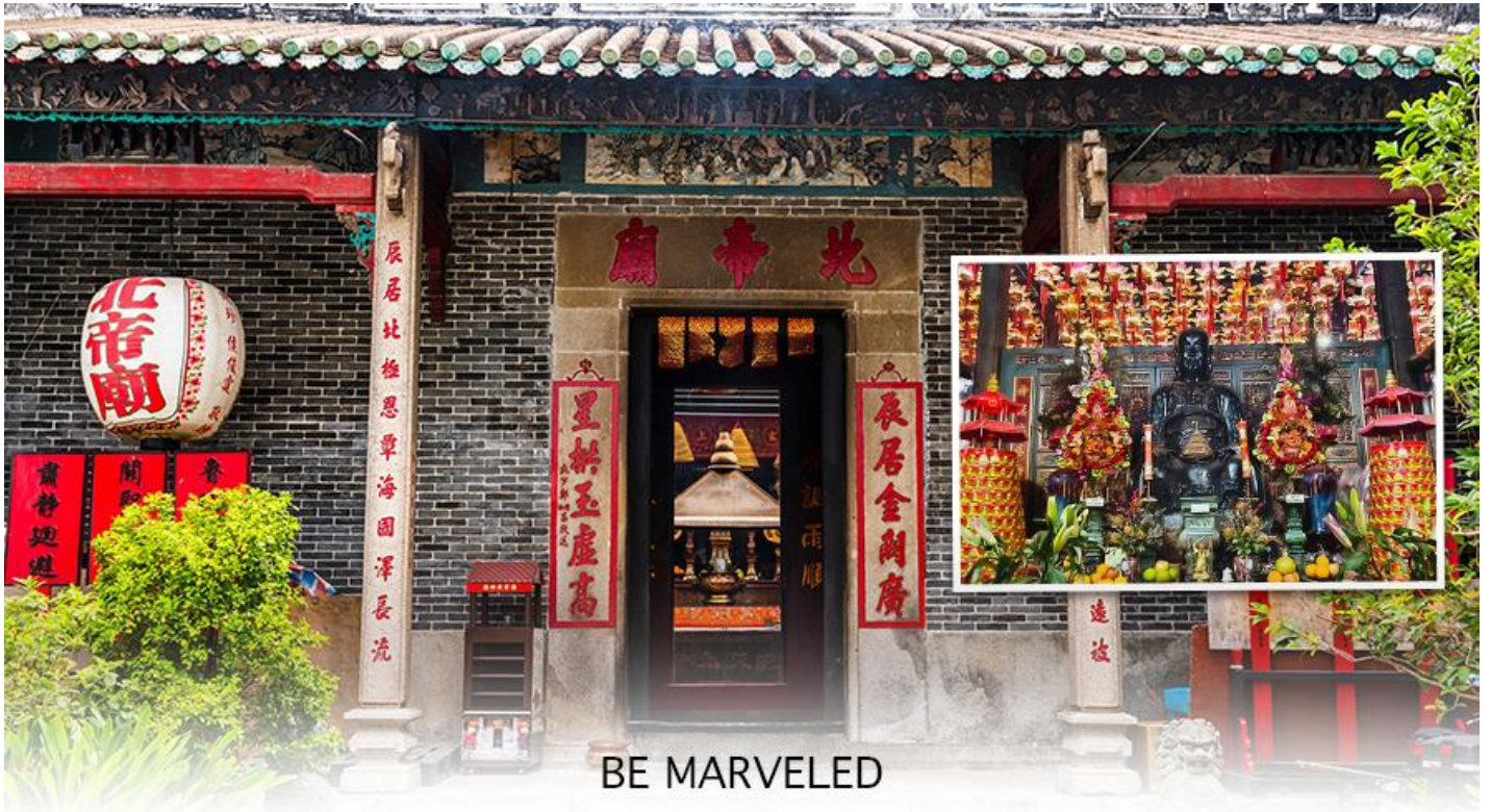
BE MARVELED วัดปักไต้

แห่งท้องทะเล ในลัทธิเต๋า และชาวฮ่องกงเชื่อกันว่าผู้ใดที่เกิดปีชง หากมาทำการแก้ดวงชะตาแก้ชงประจำปีที่วัดนี้ จะทำให้ร้าย กลายเป็นดีได้ และที่วัดยังมี “เทพเจ้าเปลี่ยนใจ” ที่นิยมมาขอพรให้เรื่องที่ไม่ดี กลายเป็นเรื่องดีหรือ คนที่เป็นศัตรูของเราเปลี่ยนใจมาเป็นมิตร เป็นที่นิยมอย่างมากของชาวท้องถิ่นฮ่องกงมากราบไหว้ขอพรกันที่วัดนี้