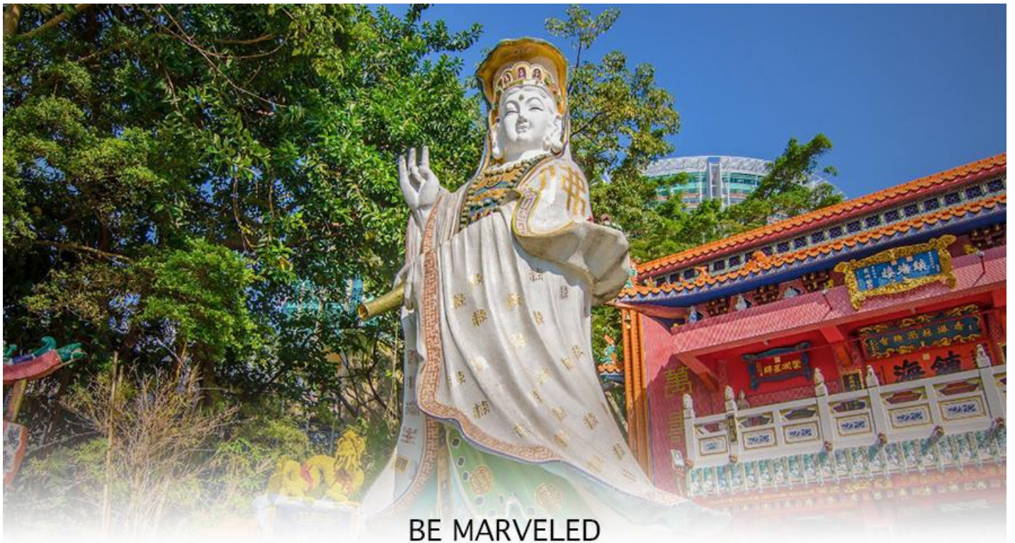
BE MARVELED วัดเจ้าแม่กวนอิมรัพลัสเบย์

ตั้งอยู่ ซึ่งคนฮ่องกงและคนจีนให้ความเคารพนับถือมากที่สุด เชื่อว่าเป็นเทพที่มีความศักดิ์มากขอพรเรื่องการเงิน การเงิน และขอพรขอ โชคลาภเพื่อเป็นสิริมงคลและขอพร เจ้าแม่ทับทิม หรือ เทพธิดาแห่งท้องทะเล ซึ่งทำหน้าที่ปกป้องคุ้มครองชาวประมง ตั้งโดดเด่นอยู่ท่ามกลางสวนสวยที่ทอดยาวลงสู่ชายหาดให้ท่านนมัสการขอ และนำท่านเดินข้าม สะพานต่ออายุ ซึ่งเชื่อกันว่าข้ามหนึ่งครั้งจะมีอายุเพิ่มขึ้น 3 ถ้าข้ามแล้วห้ามเดินย้อนกลับไปเด็ดขาด เพราะคนฮ่องกงเชื่อว่าชีวิตจะสั้นลงไป 3 ปี สำหรับคนโสดจะนิยมขอพรกับ เทพเจ้าแห่งความรัก ให้เอามือลูบที่บริเวณหินสีดำ พร้อมกับอธิษฐานให้สมหวังกับความรัก ปิดท้ายด้วยการรับพลังฮวงจุ้ยจาก ศาลา แปดทิส ซึ่งถือเป็นจุดรวมรับพลัง ถือเป็นจุดที่มีฮวงจุ้ยดีที่สุดของเกาะฮ่องกง และยังมีรูปปั้นองค์เทพอีกมากมายภายในวัดแห่งนี้ ให้กราบไหว้ขอพร