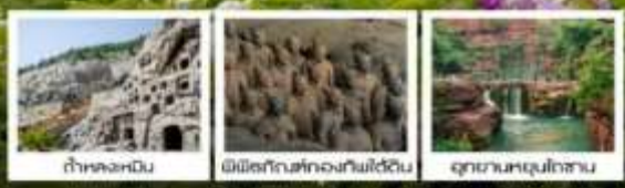
ถ้ำหลงเหมิน พิพิธภัณฑ์กองทัพใต้ดิน อุทยานหยุนโกซาน