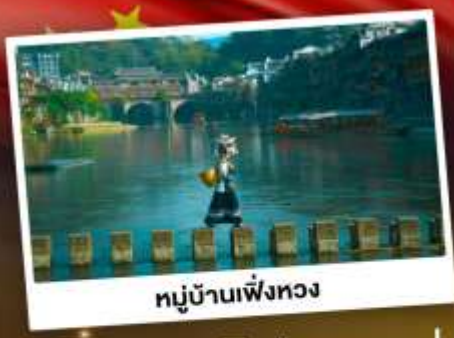
หมู่บ้านเฟิ่งทง

สุดคุ้ม!! พัก 5 ดาว ทุกคืน มนตร์เสน่ห์เมืองเก่า ริมสาងน้ำแจ่มใสแดน