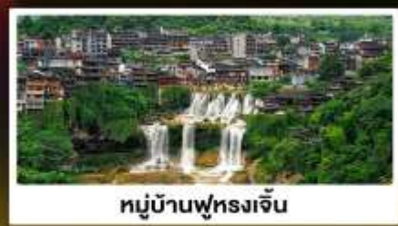
หมู่บ้านฟุทงเจิน