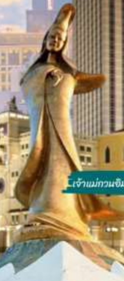
เจ้าแม่กวนอิม วิมตะธำ