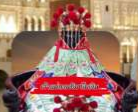
วัดของมาเก๊า