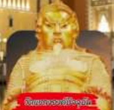
วัดของฮ่องกง