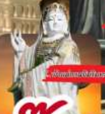
วัดของมาเก๊า