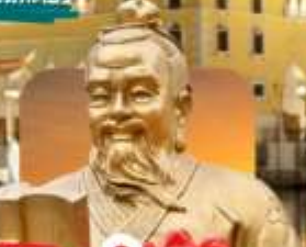
วัดของฮกเกี้ยน