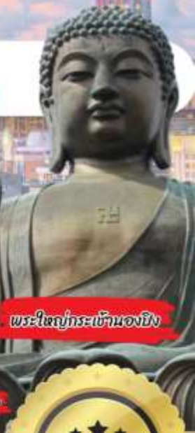
พระใหญ่กระเช้านองยี่ง