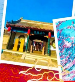
สวนองซาน