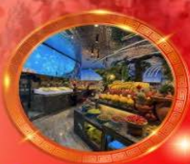
มือพิเศษ บุฟเฟต์นานาชาติ