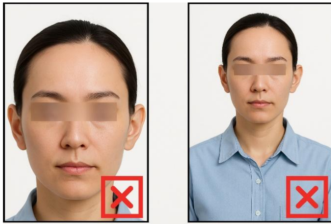
รูปที่ไม่ได้ขนาด ตามที่สถานทูตกำหนด