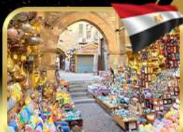
ตลาดชานเอลคาลิลี