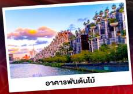
อาคารพันต้นไม้