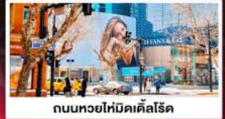
ถนนหยอไห่มีดเคิลโรด