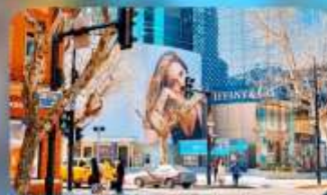
ถนนทวยไห้มิดเคิ้ลโรัด