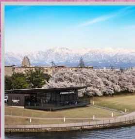
"TOYAMA KANSUI PARK"