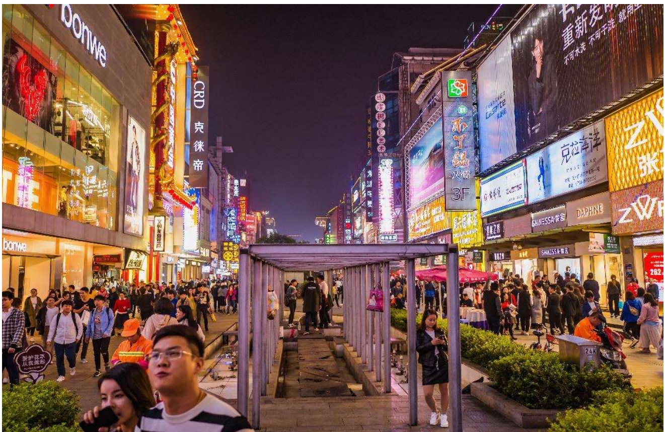
T2G-CSX16SL ZhangJiajie...ฉางซา จางเจียเจี้ย ฟู่หลงเจิ้น เฟิ่งหวง สะพานแก้ว 6D 5N (SL)