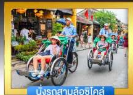
นั่งรถสามล้อซีโกล์