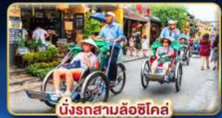
นั่งรถสามล้อฮิโค่