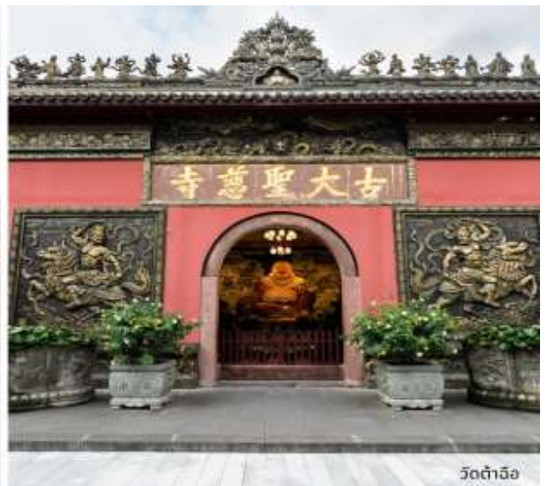
วัดต้าเจี้อ