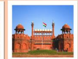
♥♦♦ Agra Fort