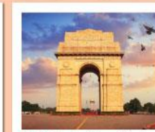
♥♦♦ India Gate