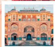
♥♦♦ Amber Fort