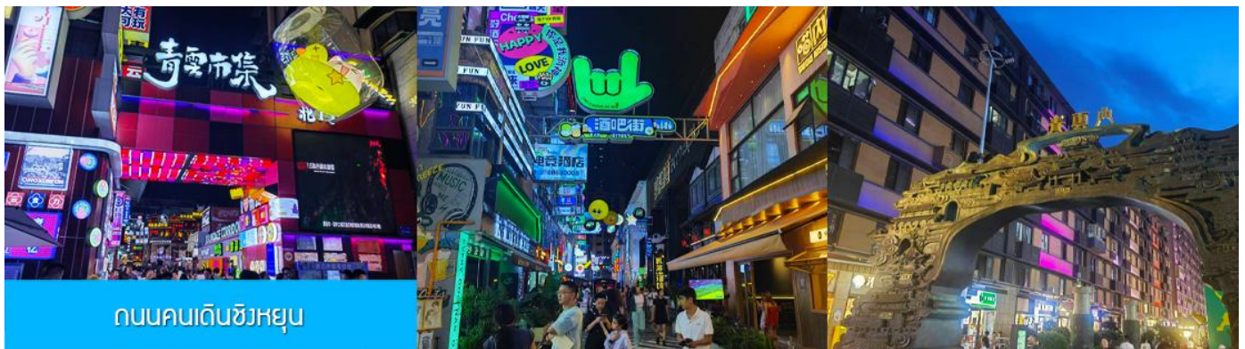
ถนนคนเดินชิงหยุน