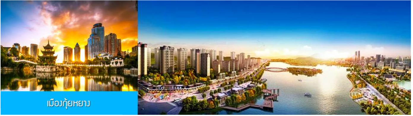
เมืองกู่หยาง