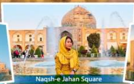
Naqsh-e Jahan Square