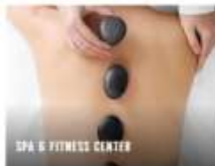
SPA & FITNESS CENTER