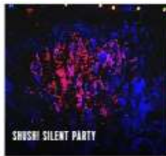
SHUSHI SILENT PARTY