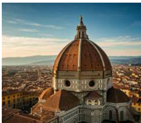
Duomo di Firenze

Piazza della Signoria: จตุรัสกลางเมืองที่รายล้อมไปด้วยอาคารสำคัญต่างๆ