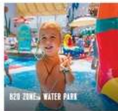
B20 ZONES WATER PARK