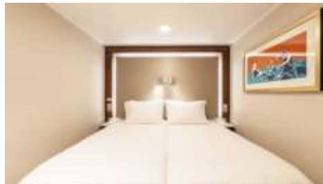
พัก 1-2 ท่าน

From 13 - 14 sq.m Max Occupancy 2-4 ^ Deck 5/8/9/10/11/12/13/15 2 Single Beds / 2 Single Beds + 1 Ceiling Pullman Bed / 1 Single Bed + 1 Pullman Bed + 1 Double Sofa Bed