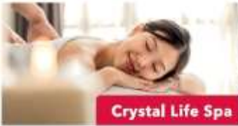
Crystal Life Spa