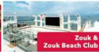
Zouk & Zouk Beach Club