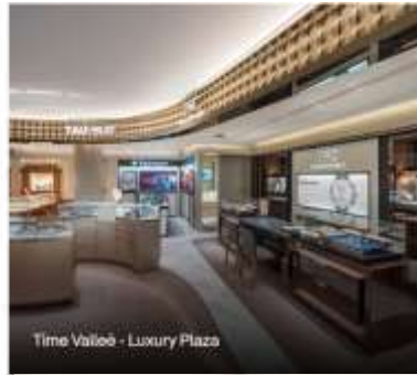
Time Valloø - Luxury Plaza