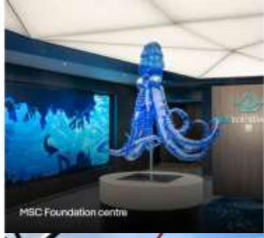
MSC Foundation centre