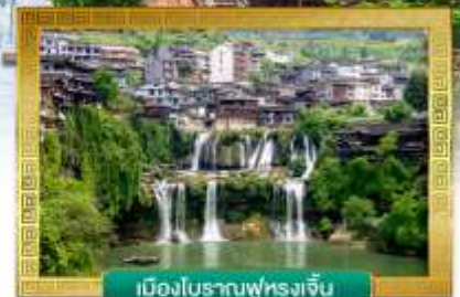
เมืองโบราณฟู่หลงเจิน