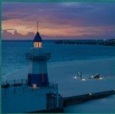
Light House Restaurant