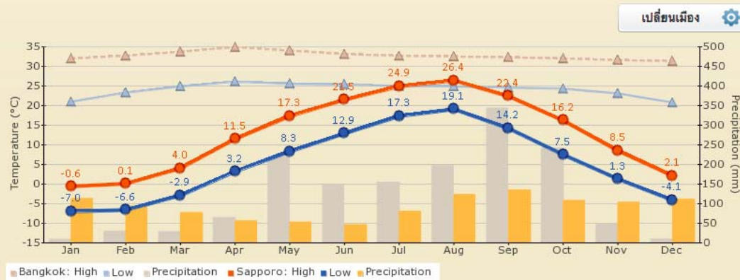
ซัปโปะโระ